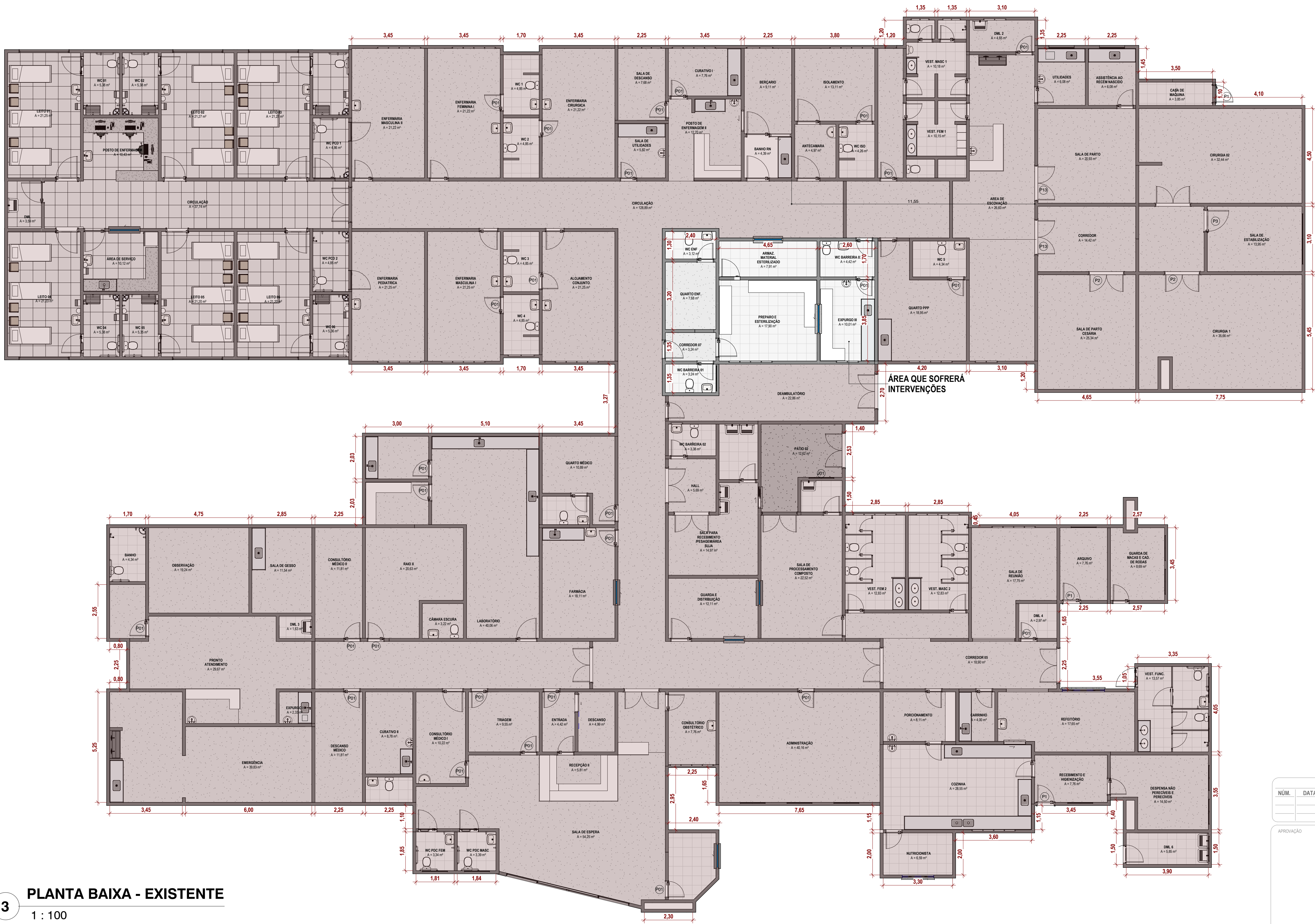
3 PLANTA BAIXA - EXISTENTE 1 : 100